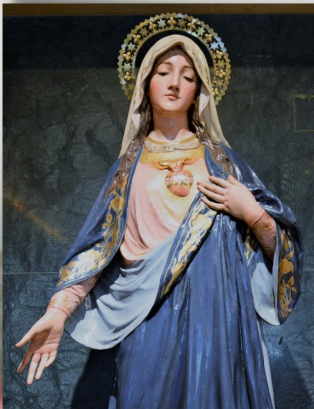
Inmaculado Corazón de María (Cripta de San José, Aidamar, Navarredonda de Gredos - Ávila)