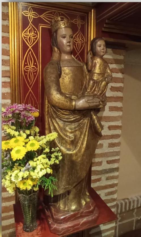
Imagen de la Virgen María (Anónimo, s. XVI, Capilla de las Cruzadas de Santa María en Loyomar, Madrid)