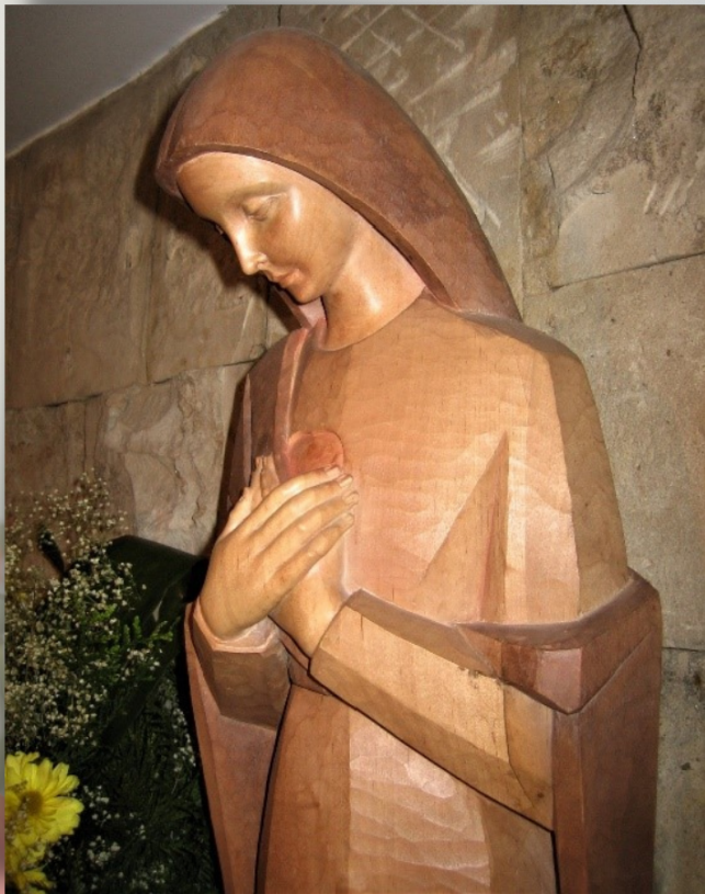
Imagen de la Virgen del Hágase (Capilla de las Cruzadas de Santa María, Salamanca)