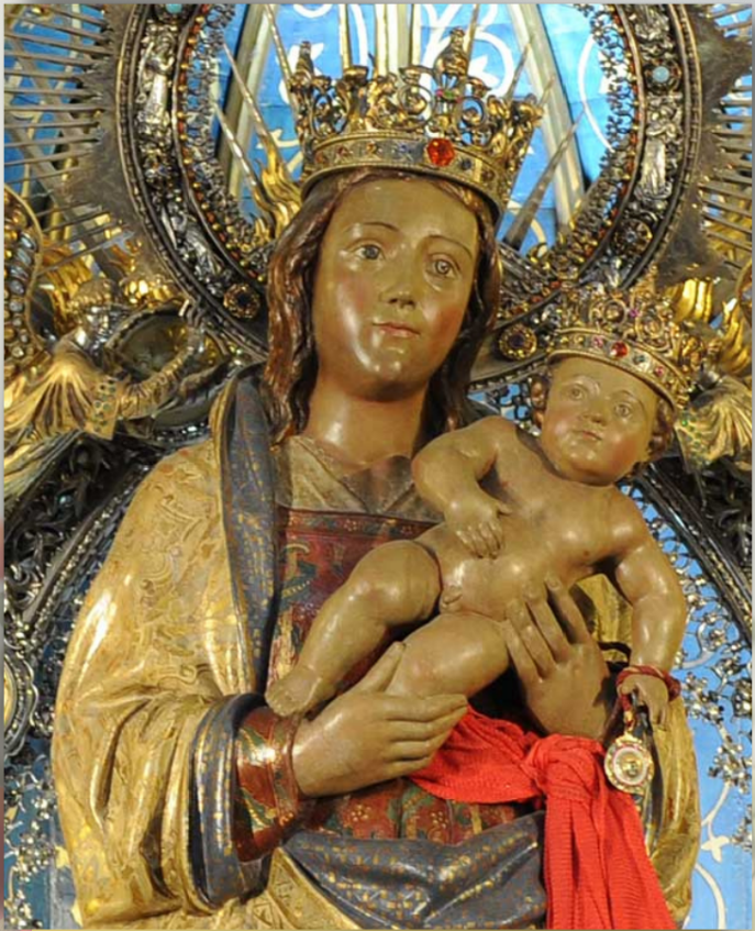
Santa María de la Almudena, Patrona de Madrid (Catedral de Madrid)