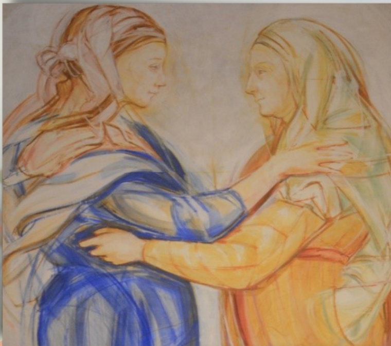
Fresco de la capilla de la Visitación de la Virgen María (Albergue Aidamar, Navarredonda de Gredos, Ávila)