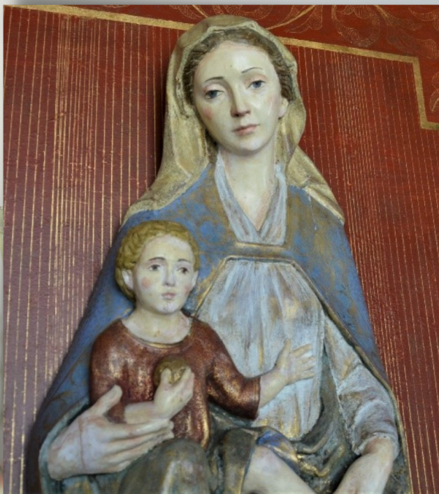
Imagen de la Virgen María con el Niño Jesús (Ermita de Santa María del Hogar, Aidamar, Navarredonda de Gredos -Ávila)