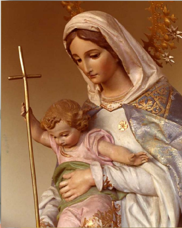
Imagen de Nuestra Señora del Recuerdo (Colegio de la Compañía de Jesús, Chamartín de la Rosa, Madrid)