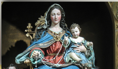
Virgen del Rosario de L. S. Carmona (Madrid)

Isabel de la Trinidad nos enseña también a vivir con María este trance postrero: “[...] Es la Virgen, ese ser todo luminoso, quien me tomará de la mano para llevarme al cielo”. Ella hará lo mismo con cada uno de sus hijos. ¡Dulce Corazón de María, sed mi salvación! (Ib., p. 577 y 578).