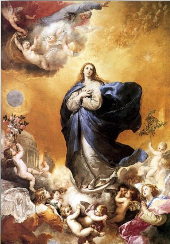
Inmaculada Concepción (José de Ribera, Iglesia del Convento de las MM. Agustinas Recoletas, Salamanca)