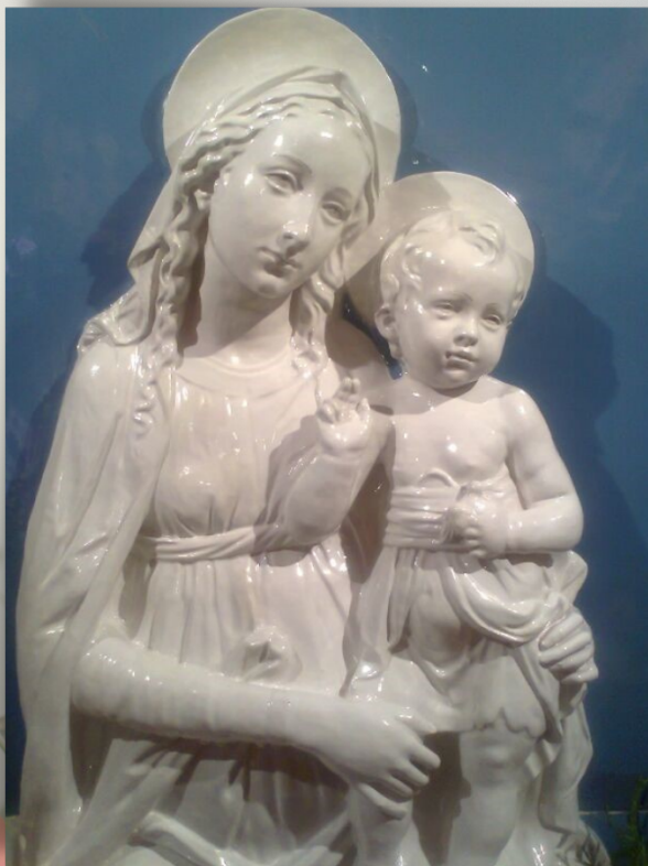
Imagen de la Virgen con el Niño Jesús (Cripta del Venerable P. Morales, Rovacías, Madrid)