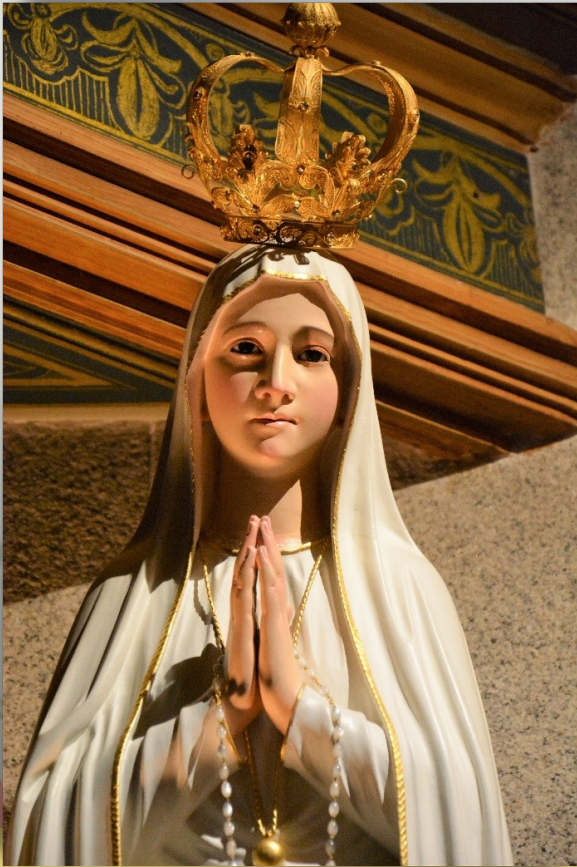
Imagen de Nuestra Señora de Fátima (Capilla de las Cruzadas de Santa María en Tellamar, Ávila)