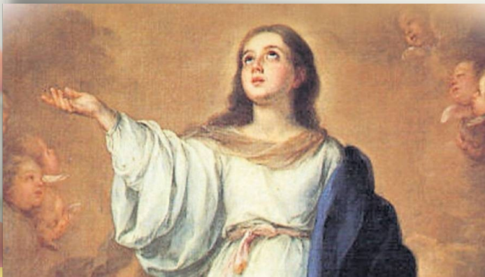
Asunción de la Virgen (B. Murillo, St. Petersburg)

Todas se las apunta Ella, bendita entre las mujeres (Ib., p. 518).