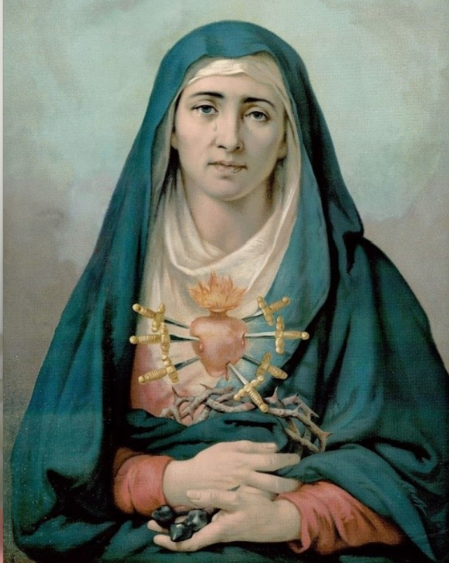
Imagen de la Virgen Dolorosa (Colegio de San Gabriel de Quito, Ecuador)