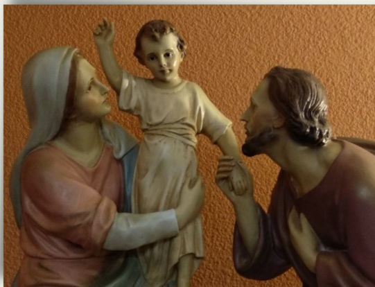
Sagrada Familia (Tellamar, Ávila)

Un modo de rezar el mes de Mayo en este año dedicado a San José, esposo de la Virgen y custodio del Señor: "Amad y reverenciad a la Virgen con el afecto íntimo y cordial, lleno de veneración y respeto con que lo hacía San José, y encontraréis en el fondo de vuestras almas un sentimiento especial hacia Ella que os llenará de paz y alegría en vuestra magnífica vocación" (Epistolario, 21.1.1962).