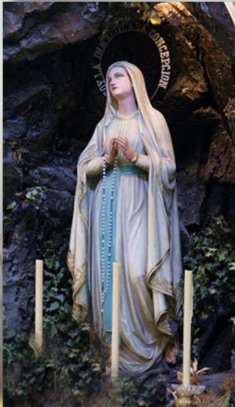
Virgen de Lourdes (Gruta de las apariciones del Santuario de Lourdes, Francia)